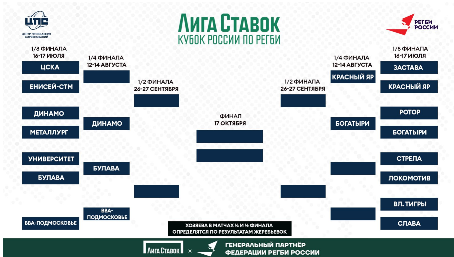
Схема Плей-офф Кубка России по регби